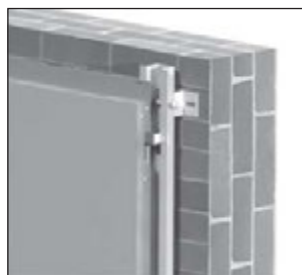
CH Sistema de cuelgue