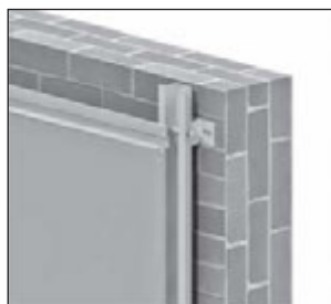
SZ Sistema macho-hembra